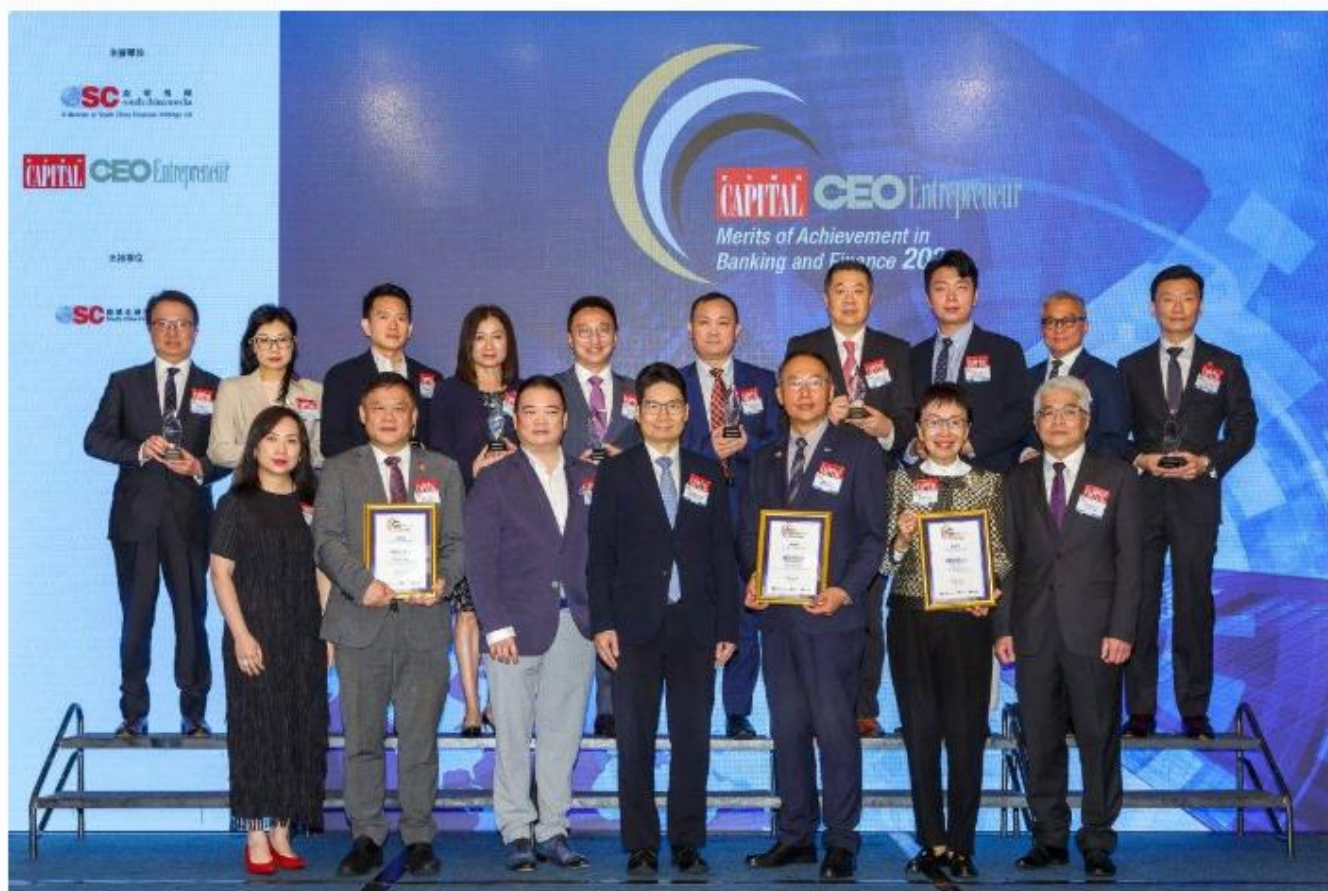
《資本平台》管理層、一眾出席嘉賓及得獎企業代表一同合照

作為國際金融中心，香港金融業務在有效、透明，以及符合國際標準的監管下運作。憑藉在資本市場、資產管理和保險方面的優勢，香港不但成為金融服務的首選地點，也是許多金融機構的總部所在。香港為世界各地的投資者、融資者、資產管理人、基金和保險業提供全方位和高質素的金融平台服務。為表揚金融界各範疇的企業一直以來對香港經濟作出的貢獻，《資本雜誌》將繼續舉辦「資本卓越銀行及金融大獎」，希望鼓勵業界提供更多元和貼身的服務。