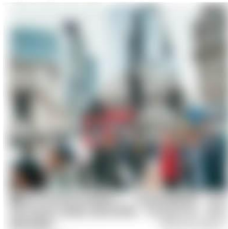
詢相關的專業人士。

以上只是理財知識的分享，所提及的例子僅供參考，不構成任何形式的投資及稅務意見，如有興趣的朋友，宜進一步根據自身的財務狀況諮詢相關的專業人士。