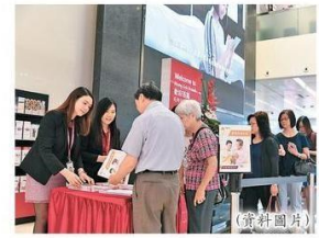
■港府近年推出的年金計劃，成為受歡迎的理財產品。

這個指標是保監局要求保險公司每年向公眾公布的，通過計算所有相關保單實際派發累積非保證利益的總數額，除以銷售時所宣告的總數額而得出。當分紅實現率接近100%時，表示保險公司已接近或達到銷售時預期的非保證利益，反之亦然。如果比率高於100%，則表示實際派發金額高於銷售時利益說