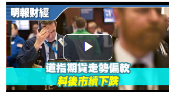
【有片：埋身擊】道指期貨走勢偏軟 料後市續下跌