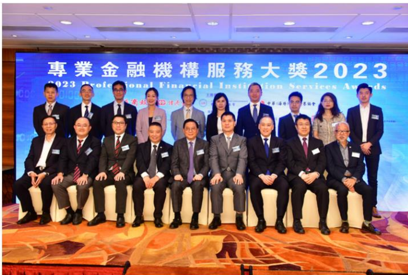
「專業金融機構服務大獎2023」頒獎典禮昨日圓滿舉行。

員林健鋒致辭時稱，根據今年3月《全球金融中心指數》報告，香港總排名位居全球第4位，反映香港作為全球領先金融中心的實力和優勢。相較其他金融中心，香港金融從業員對所屬城市的展望和競爭力充滿信心，這都有賴金融服務業界長久以來的不懈努力和國家對香港的支持。