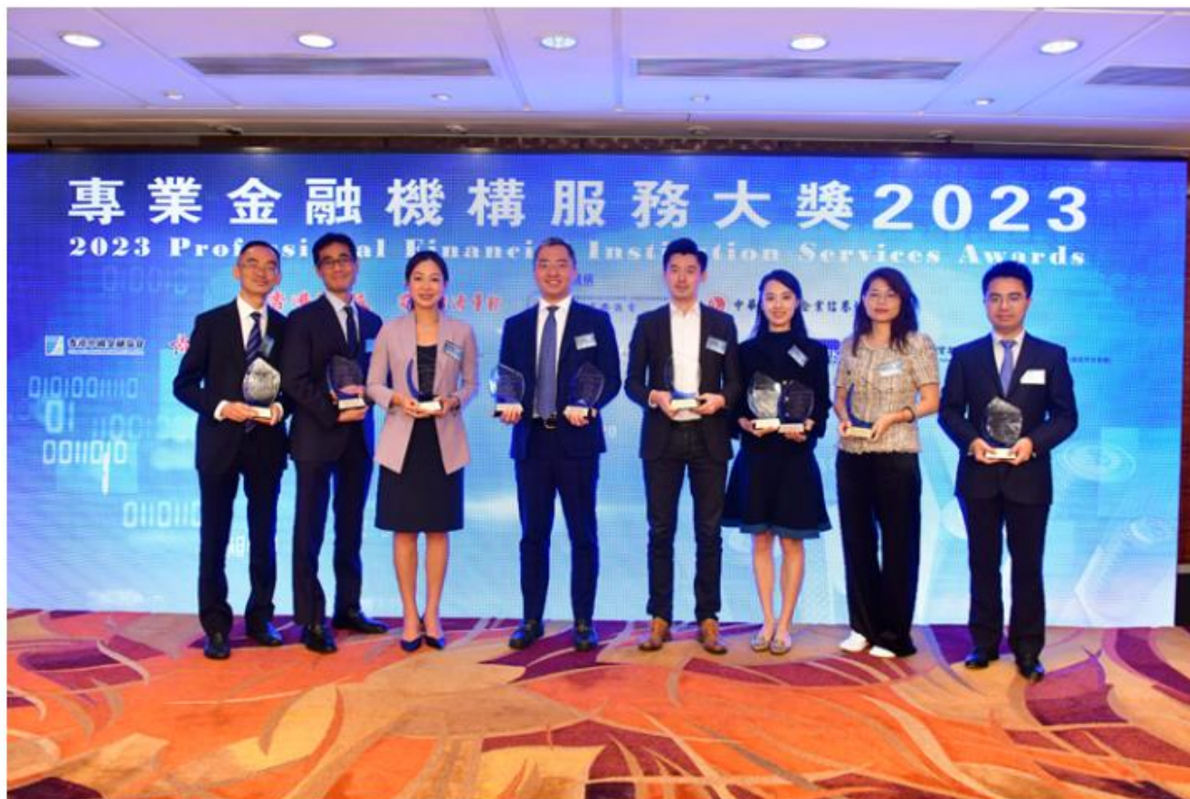
八家獲獎機構代表大合照。

頂圖圖說：林健鋒相信未來可採用雙櫃台模式交易的股份會增加，進一步促進離岸人民幣向國際市場流動。