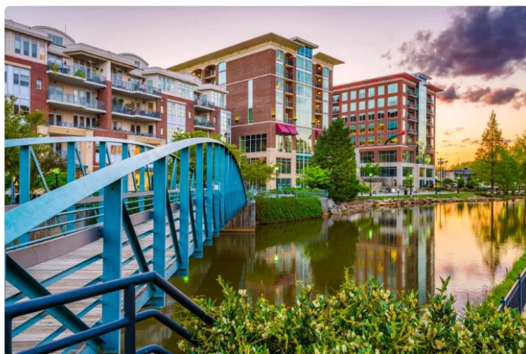
美國南卡羅萊納州Greenville市，成為近期興起的滯留移民目的地。

雖然現金不足，不過美國人整體都有充裕淨資產，65歲至74歲平均淨資產為120萬美元，75歲以上為95.8萬元。美國聯邦儲備銀行在計算這個數字時涵蓋資產包括退休金、存款、債券、股票、人壽保險現金價值、公司資產等，並扣除信用卡、按揭、汽車貸款等債務。