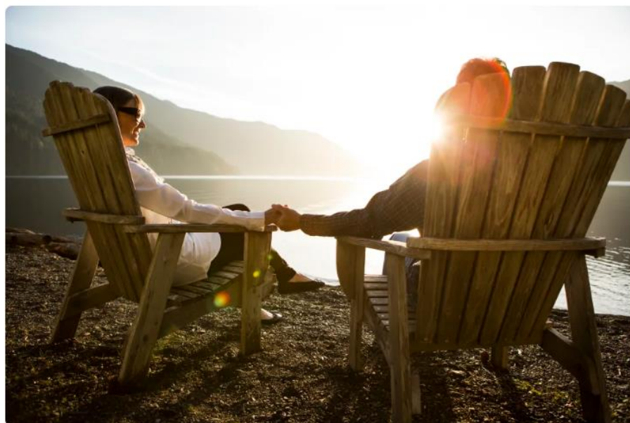
生活指數與香港相若的美國，一般建議要有一百萬美元才能過得舒適地退休。

據統計，港人要有較佳的退休生活要有900萬元，而在生活指數與香港相若的美國，一般建議要有一百萬美元（約780萬港元），晚年才能過得舒適，但美國人習慣「大使」據業內人士估計只有10%美國人能達到這個退休儲蓄要求。