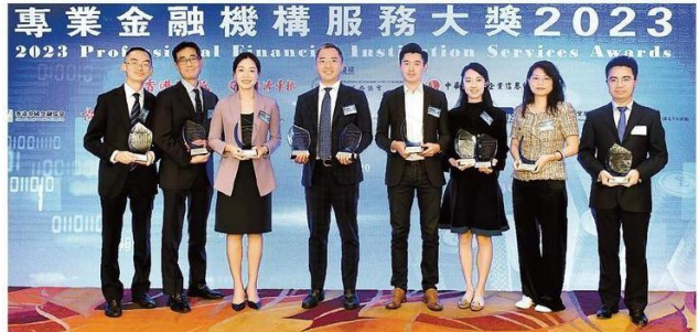
八家獲獎機構代表大合照。