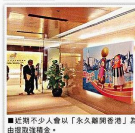
■近期不少人會以「永久離開香港」為由提取強積金。

與香港及美國之間一樣，香港與澳洲目前沒有雙邊雙重徵稅協定，這意味澳洲稅務居民源自香港的收入有機會被雙重徵稅，即在香港根據香港的地域來源徵稅原則被徵稅，以及在澳洲根據全球收入原則被徵稅。話雖如此，如果移民人士已向特區政府繳納來自香港收入的稅項，有權向澳洲政府要求抵銷稅項。