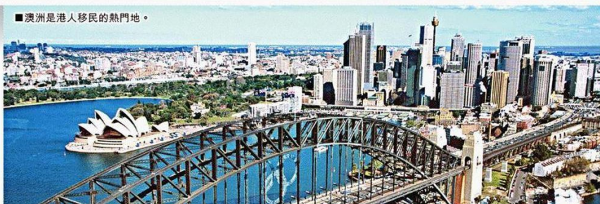
■澳洲是港人移民的熱門地。

如果要選一項移民最令人苦惱的事，不得不提稅務處理，畢竟港人習慣了香港的稅制簡單，當面對移民目的地繁複的稅制自然大感煩惱。更甚是不少西方發達國家普遍採取全球徵稅，逃避絕對不是解決方法。其中，澳洲是港人移民的熱門地方，今期《向世界錢進》邀請了理財專家來分享澳洲稅制要留意的地方。