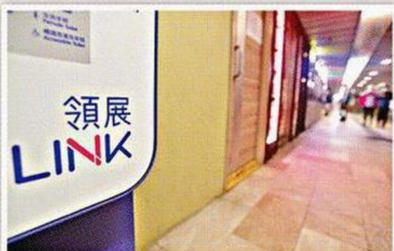
■領展在本港管理多個商場，租金收入具保證。

其實，投資物業不一定要「All in」，只要善用金融工具，也可以低門檻享受物業升值和收租的好處，購買房地產信託基金（REITs）就是不錯的替代選項。